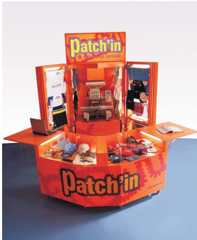
Quiosco Patch'in abierto

Patch'in es un nuevo concepto comercial que ha sido especialmente diseñado para ubicar una tienda de bordados personalizados en espacios cubiertos y con gran afluencia de público, como centros comerciales.