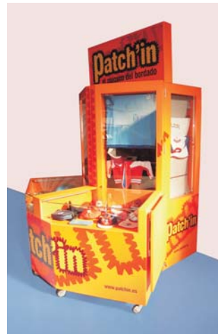
Quiosco Patch'in cerrado